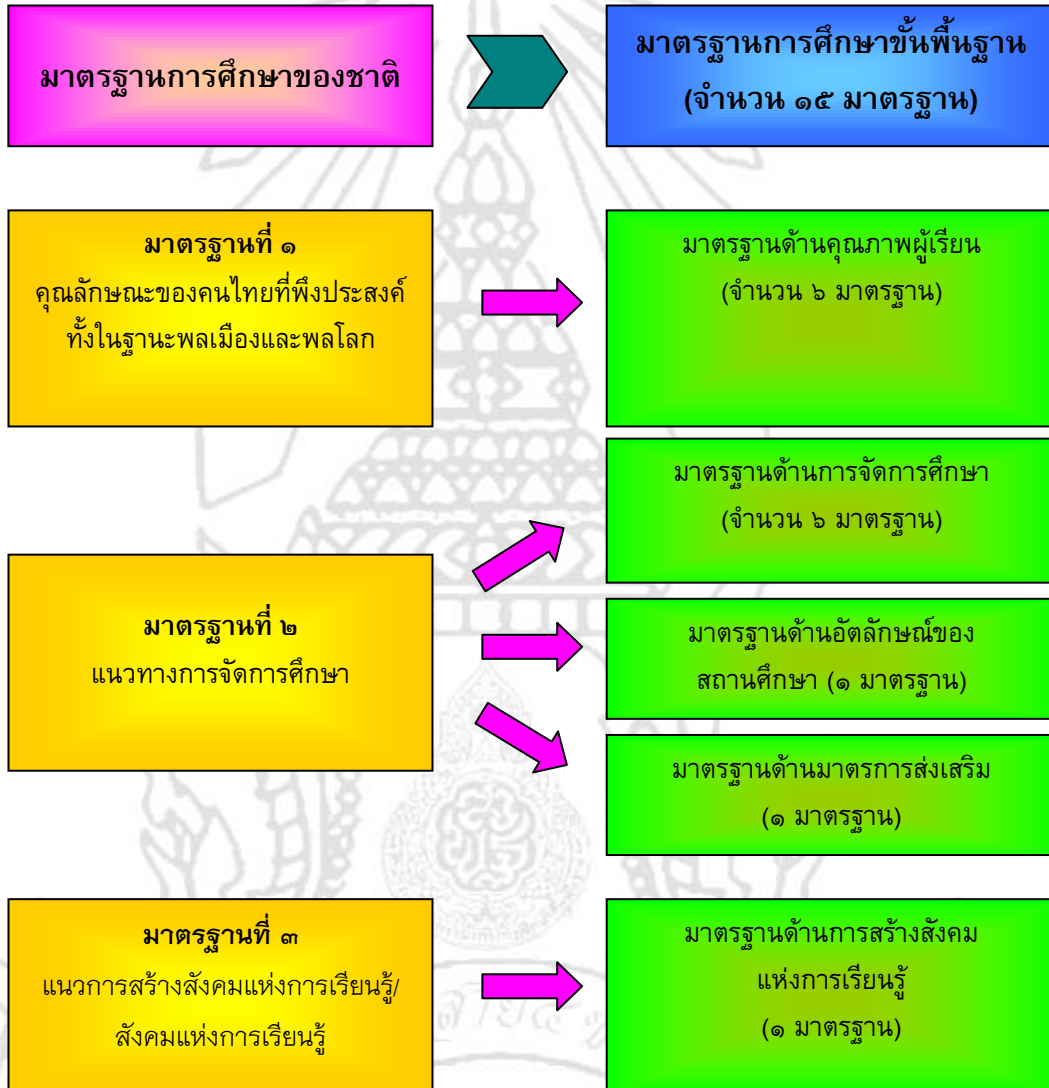
แผนภาพ ๔ โครงสร้างมาตรฐานการศึกษา